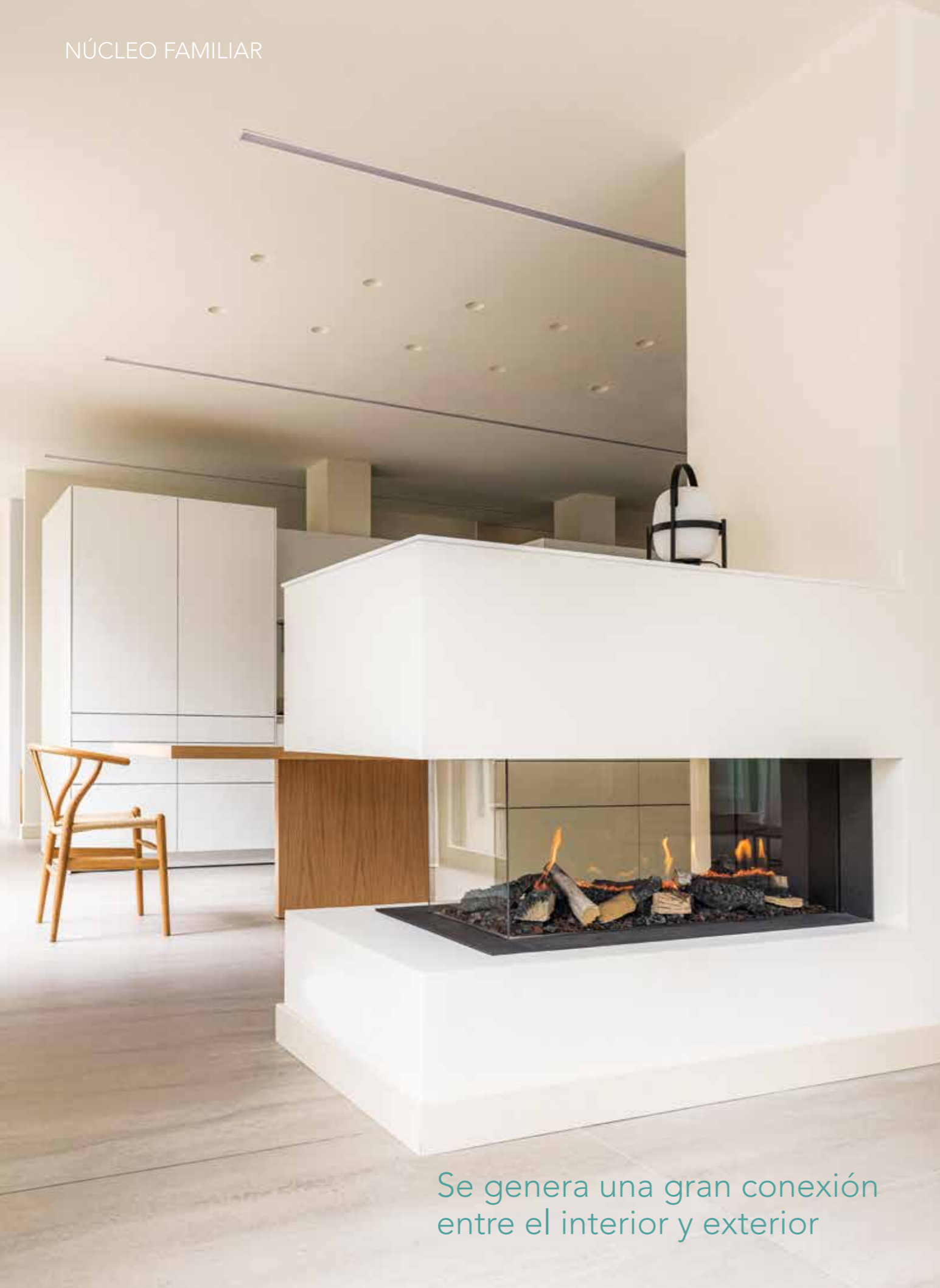
Se genera una gran conexión entre el interior y exterior